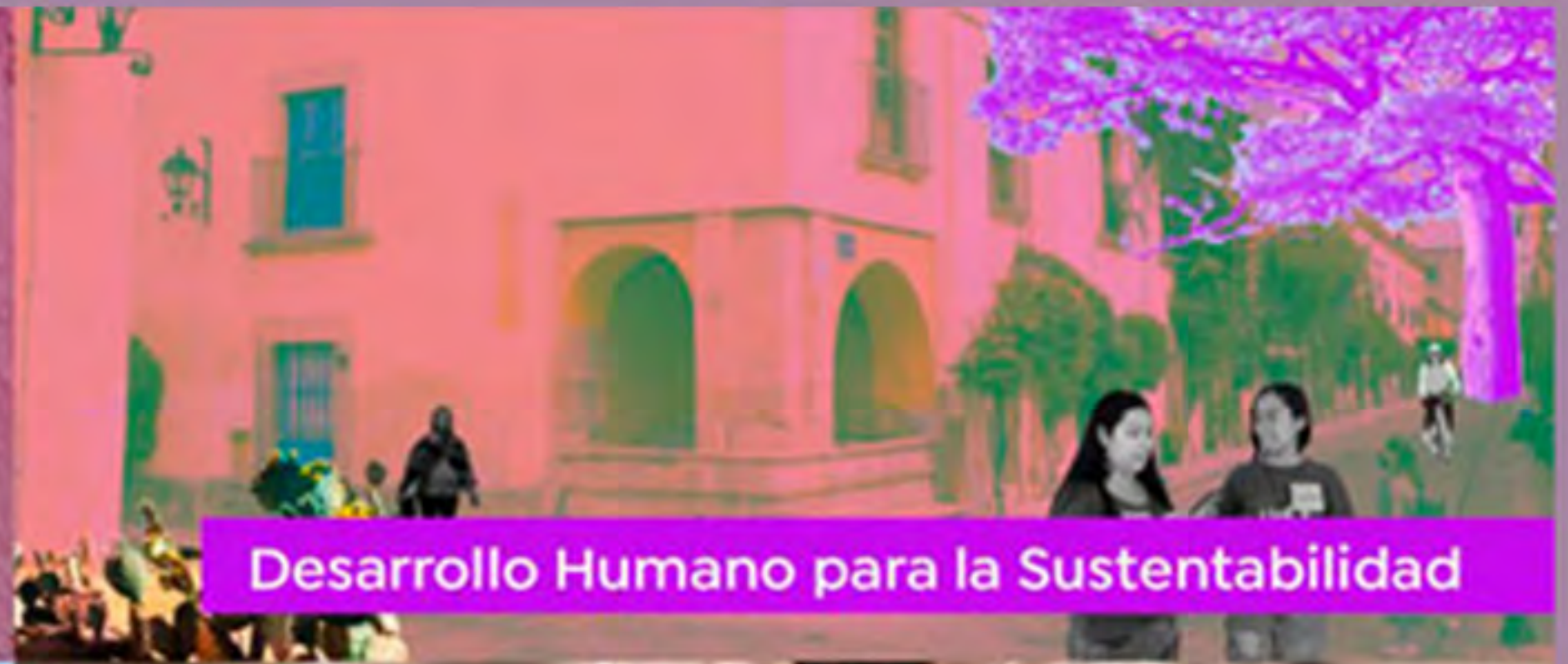
Desarrollo Humano para la Sustentabilidad