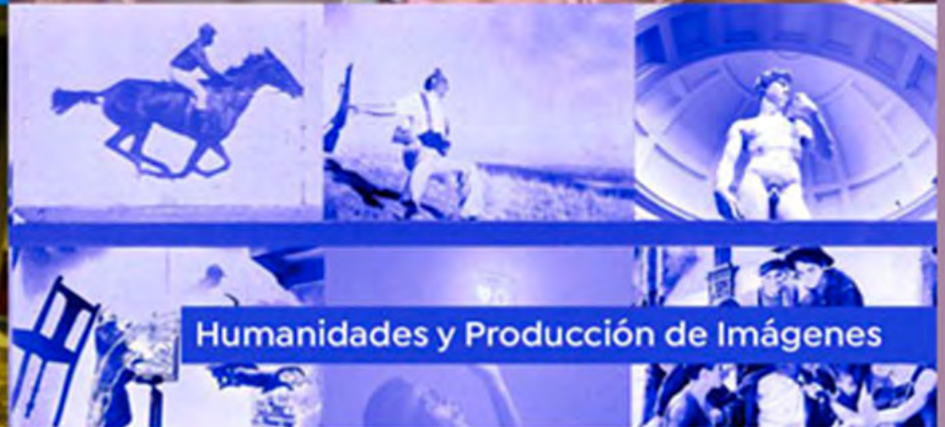
Humanidades y Producción de Imágenes